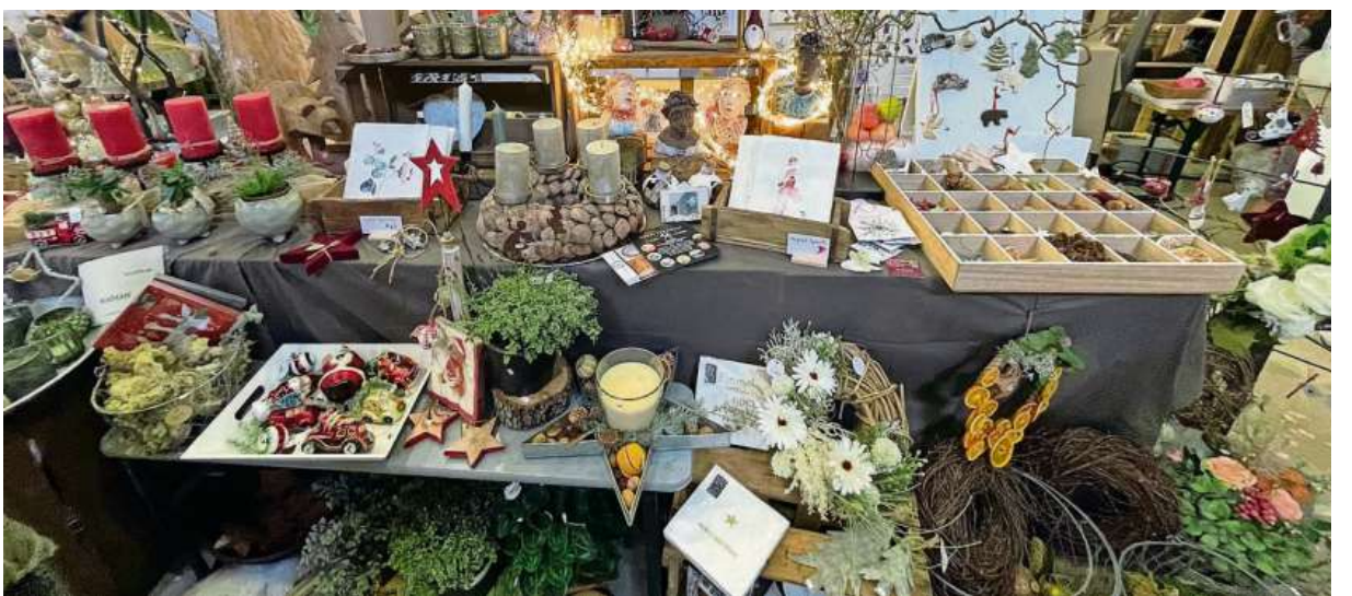
Zauberhafte Fundstücke machen den Bummel über den winterlichen Geschmackvoll-Markt in Übach-Palenberg für Besucher zu einem Erlebnis. Zwischendurch können sie Streetfood-Leckereien kosten. (red)

Weitere Infos: www.geschmackvoll-designtrifft-genuss.de (red)